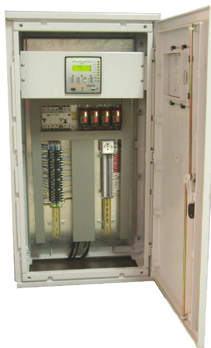
Verzija sa IP55 ku ištem